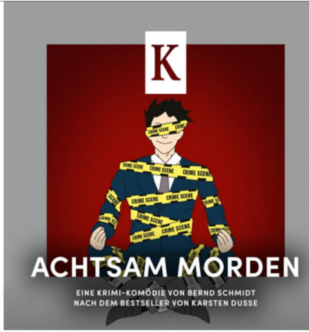
Bilder von der Webseite der Kammerspiele Seeb