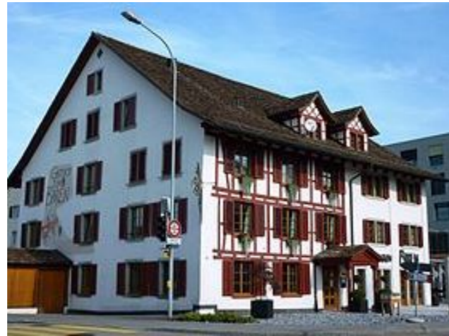
Spaziergang von Bassersdorf nach