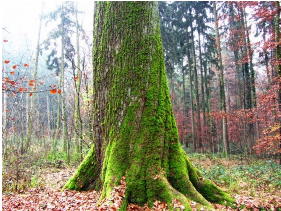
Dicke Eiche Nassenwil

Route: Wir wandern vom Bahnhof Oberglatt in Richtung Nassenwil zur Crossair-Absturzstelle und der dicken Eiche. Fortsetzung nachher Richtung Dielsdorf.