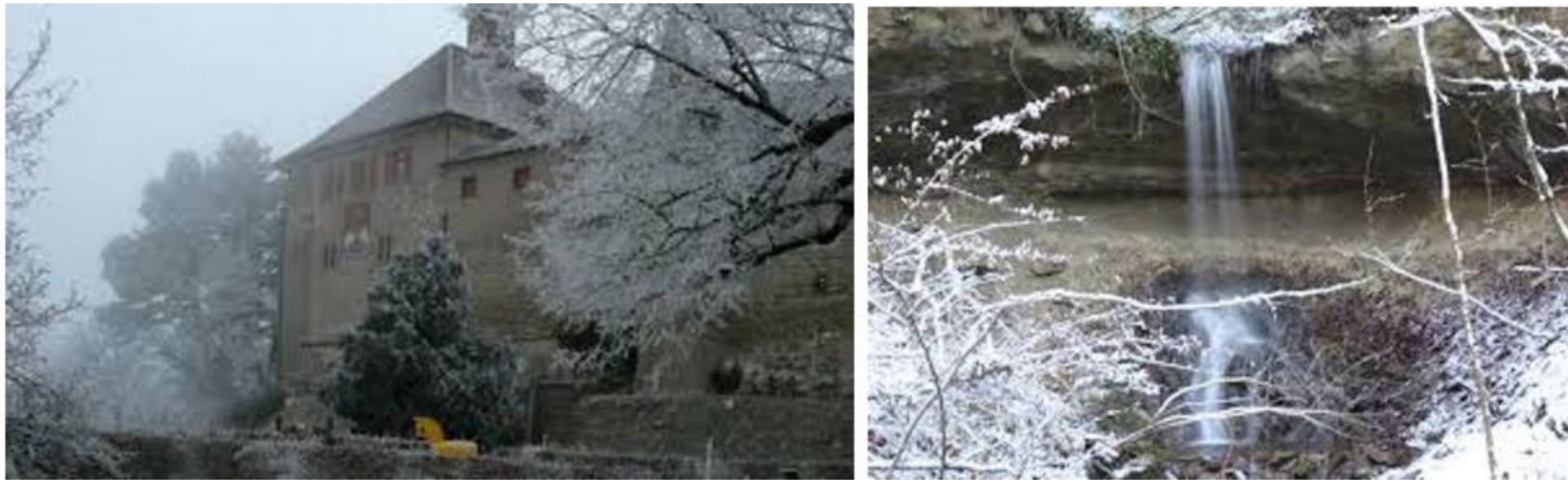
Schloss Kyburg und Tätsch-Felsen