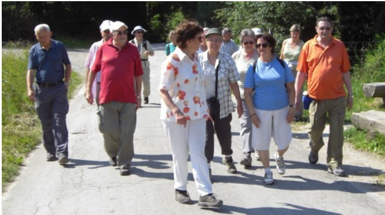
Dietlikon, Wallisellen, Opfikon, Kloten.

Route: Wir wandern wie vor 11 Jahren (23.6.2008) „chrüz und quer“ durch den Hardwald und um zu sehen, was sich seit damals verändert hat. Wie kommt der Wald mit den vielen Anforderungen zurecht? Welche Erwartungen haben wir als Anwohner und Nutzer vom Hardwald, der eingeschlossen ist von den rasch wachsenden Agglomerationsgemeinden Bassersdorf,