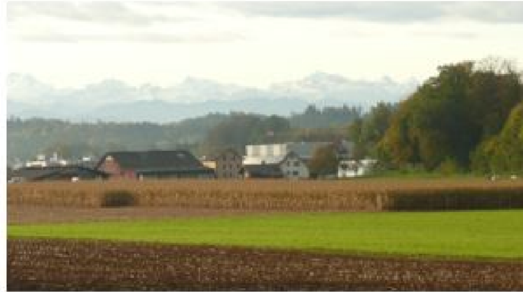
Oberhalb Illnau Staldenweiher oberhalb Fehraltorf →