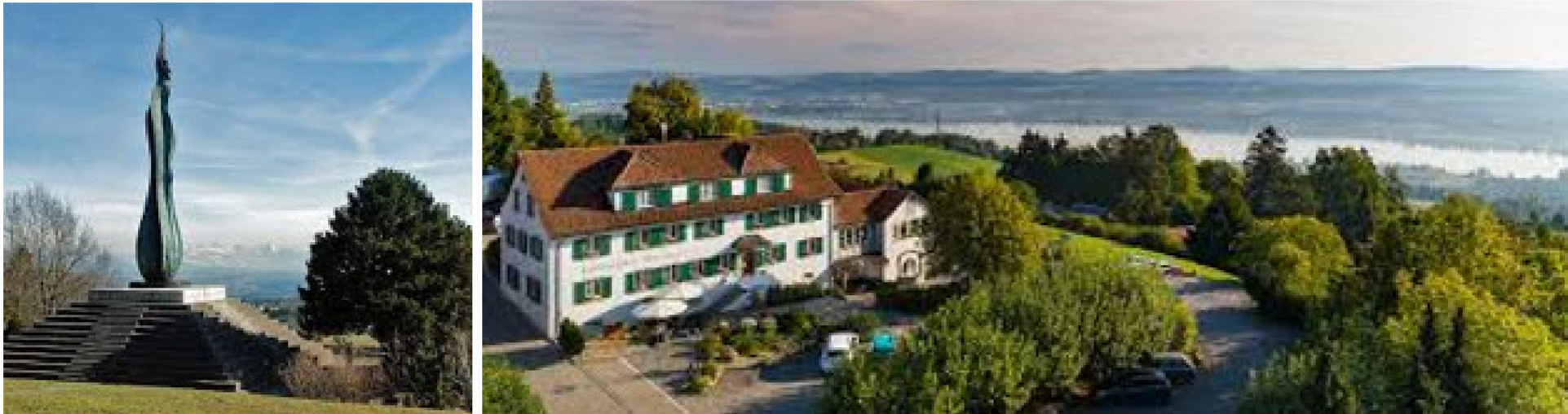
Bilder aus Internet

Route: Wir spazieren im Raum Zollikerberg-Forch von Waltikon zum Ausichtsrestaurant Wassberg und fahren von Ebmatingen zurück nach Bassersdorf.