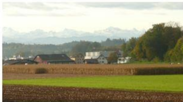
Oberhalb Illnau Staldenweiher oberhalb Fehraltorf →